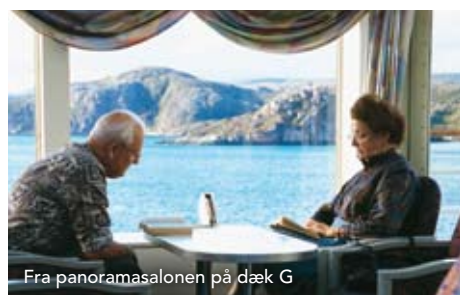
Fra panoramasalonen på dæk G